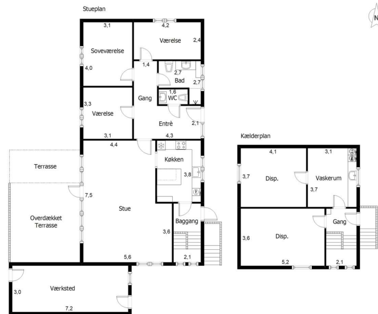
Vejledende plantegning uden ansvar.