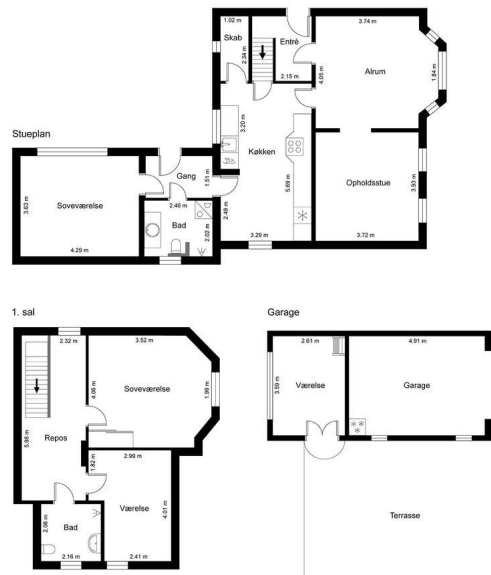
Vejledende tegning uden ansvar