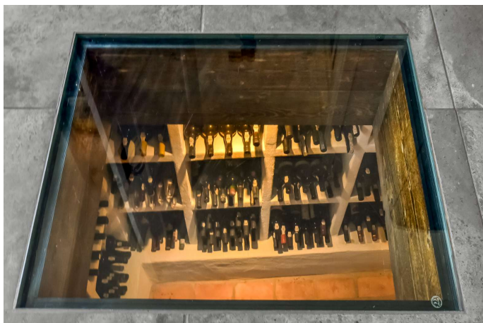
"Udsigt" til vinkælderen