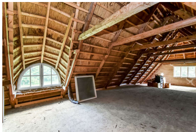
Tagetage over gildesal