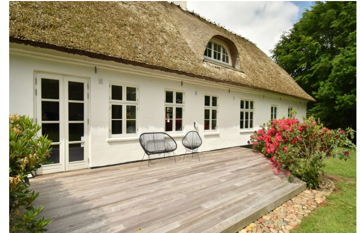
Facade og terrasse mod øst