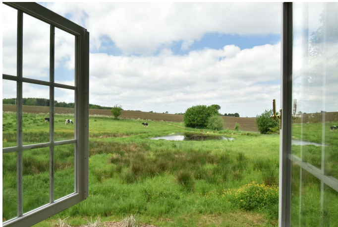
Udsigt fra havepavillon