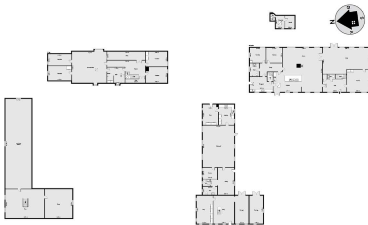
Vejledende tegning uden ansvar! (Profilm.dk)