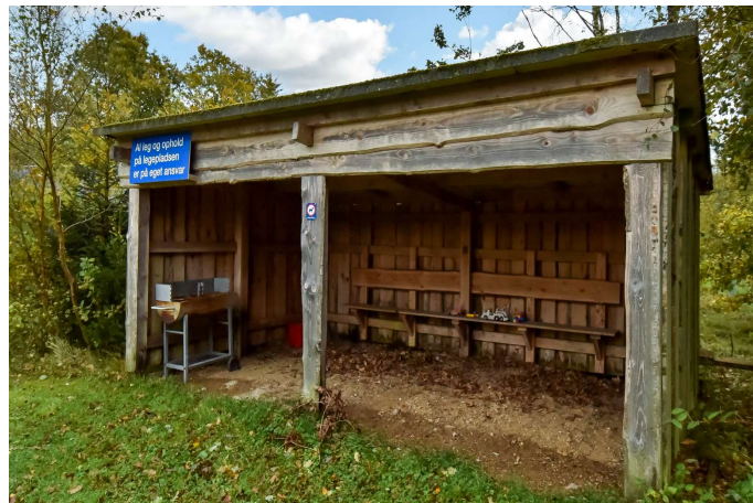
Legeplads i området