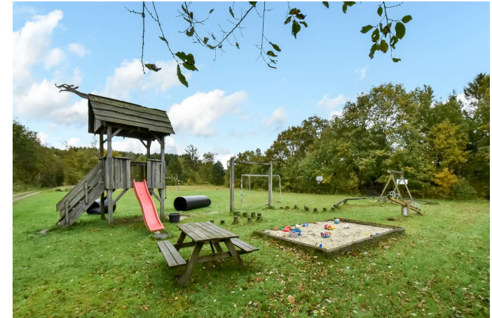
Legeplads i området