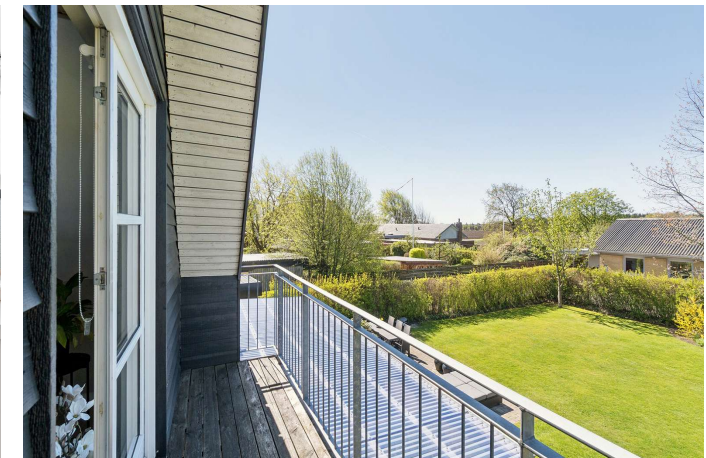
Altan med skøn udsigt over haven.