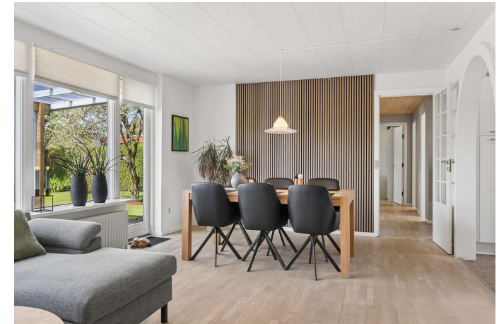
Spise- og opholdsstue med fantastisk lysindfald.