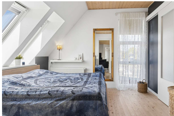
6 gode værelser inkl. soveværelse med walk-in.