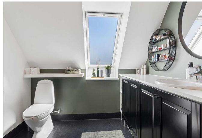
I alt 2 toiletter, herunder 1 badeværelse med brus.