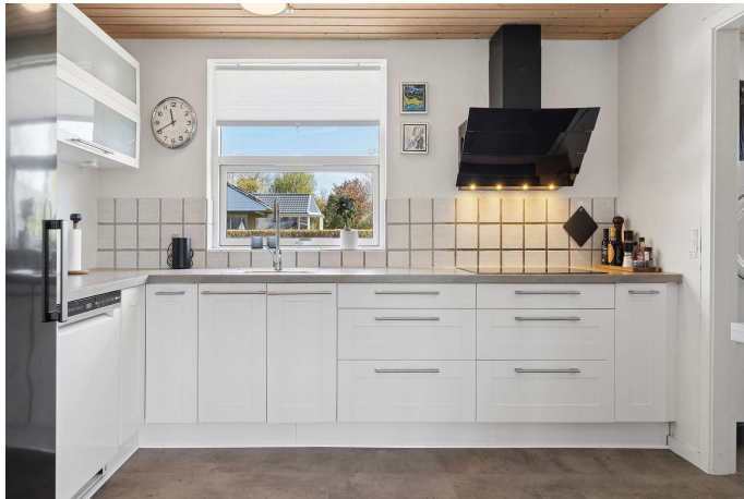
Flot køkken fra 2009