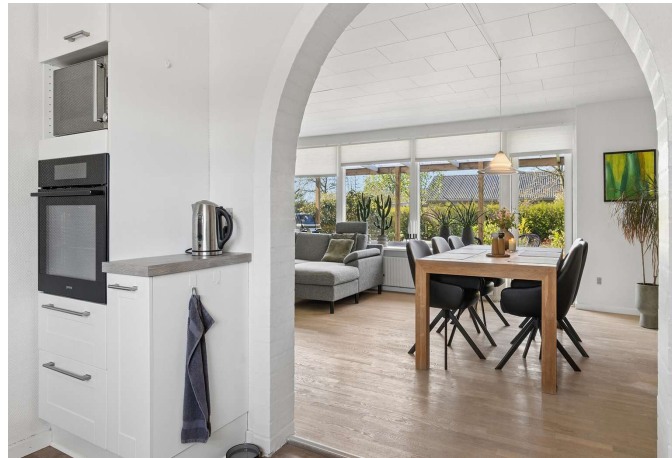
Køkkenet er i delvis åben forbindelse til spisestuen.