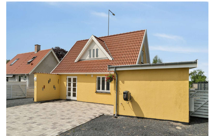
Set fra haven