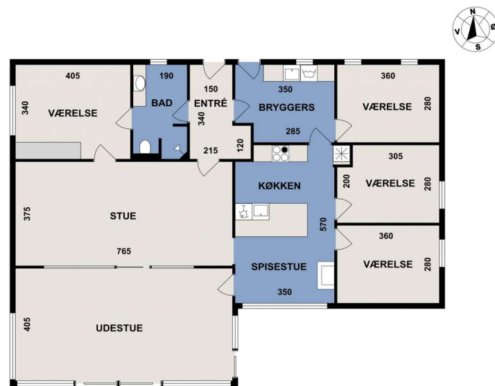
Vejledende tegning, uden ansvar. (CR3.DK)