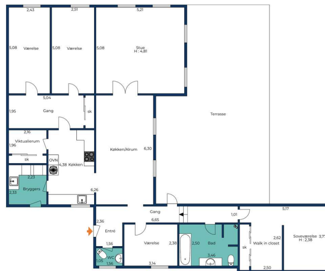
Vejledende tegning uden ansvar.