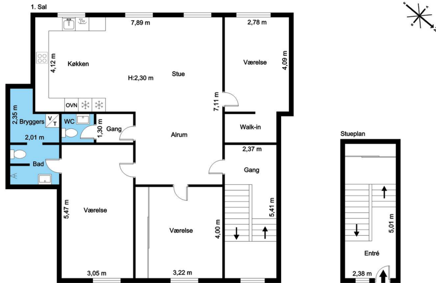
Vejledende tegning uden ansvar