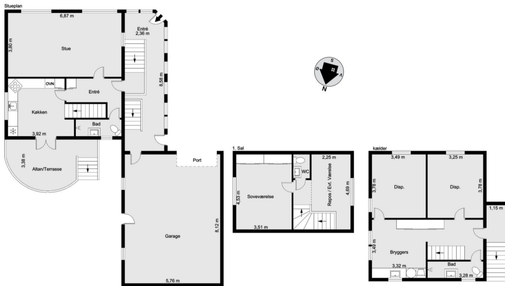
Vejledende tegning uden ansvar! (Profil.dk)