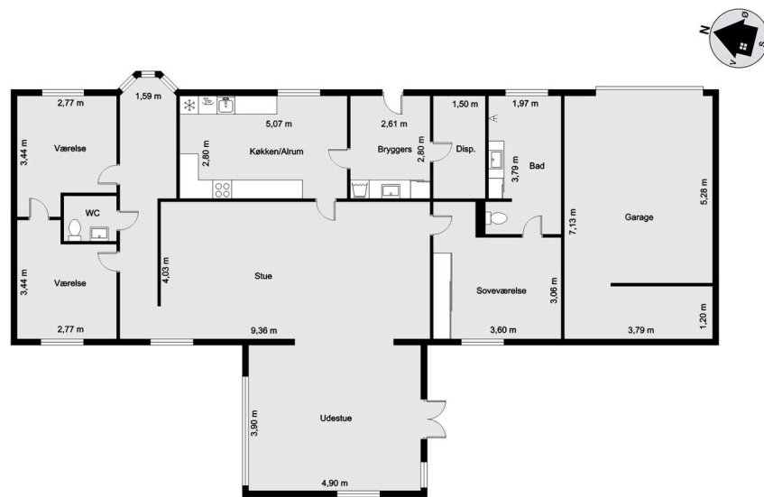
Vejledende tegning uden ansvar!