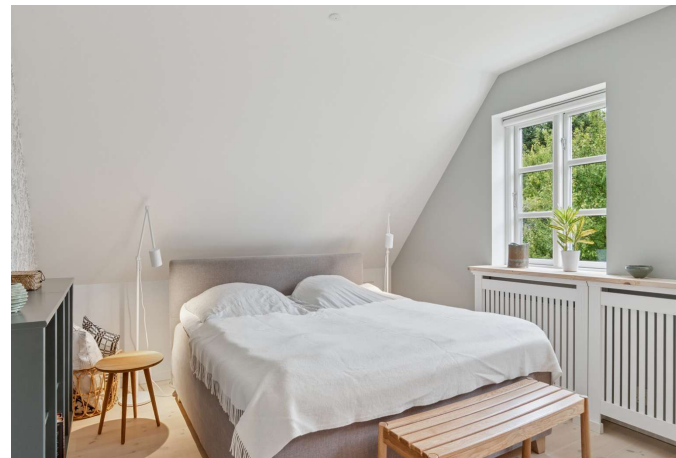
Soveværelse med skabsvæg