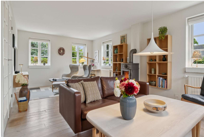
Stue med brændeovn