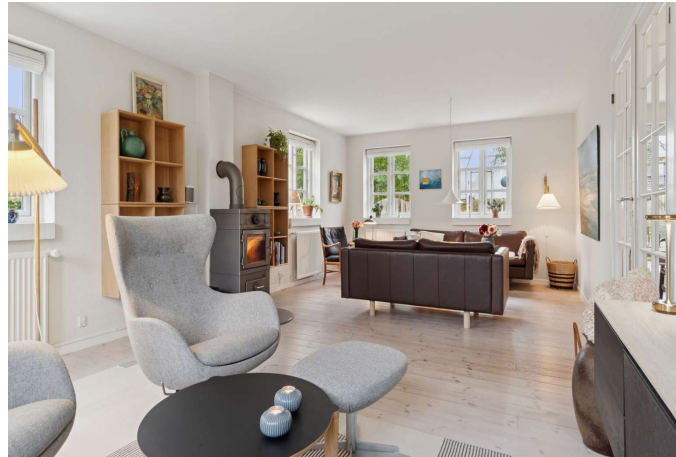
Dejlig lys stue