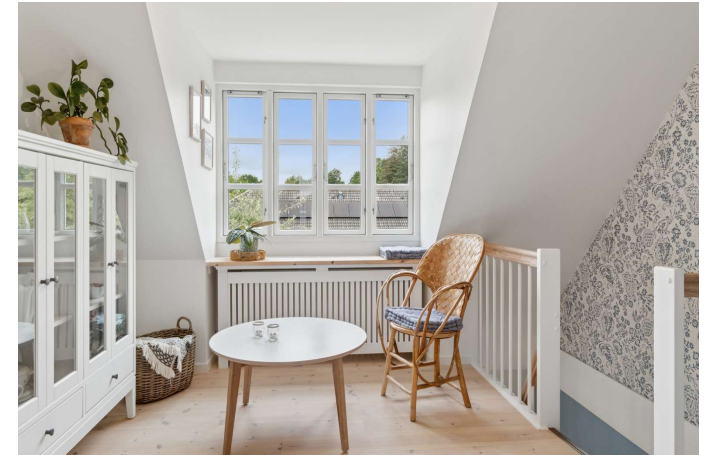
God møblerbar repos