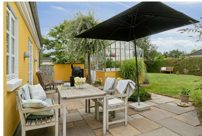
Stor flisebelagt terrasse