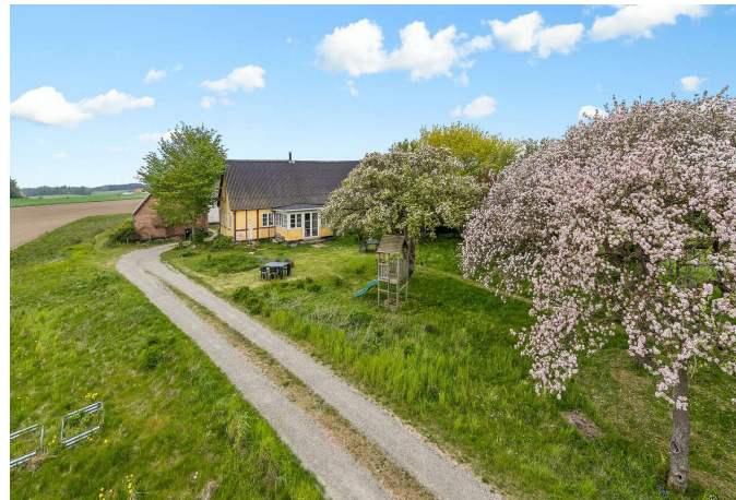
Set fra vejen