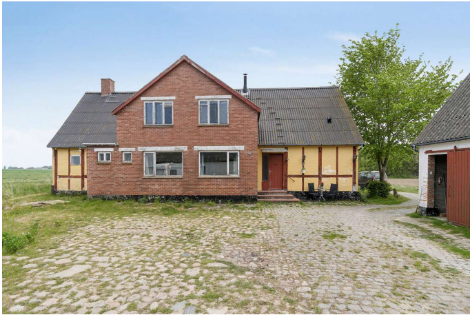
Set fra vejen