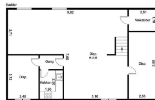
Vejledende tegning uden ansvar