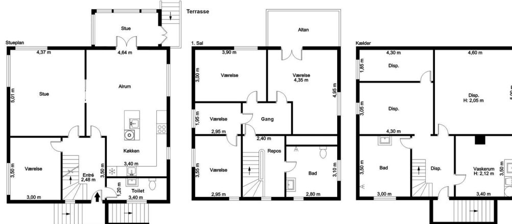
Vejledende tegning, ikke målfast