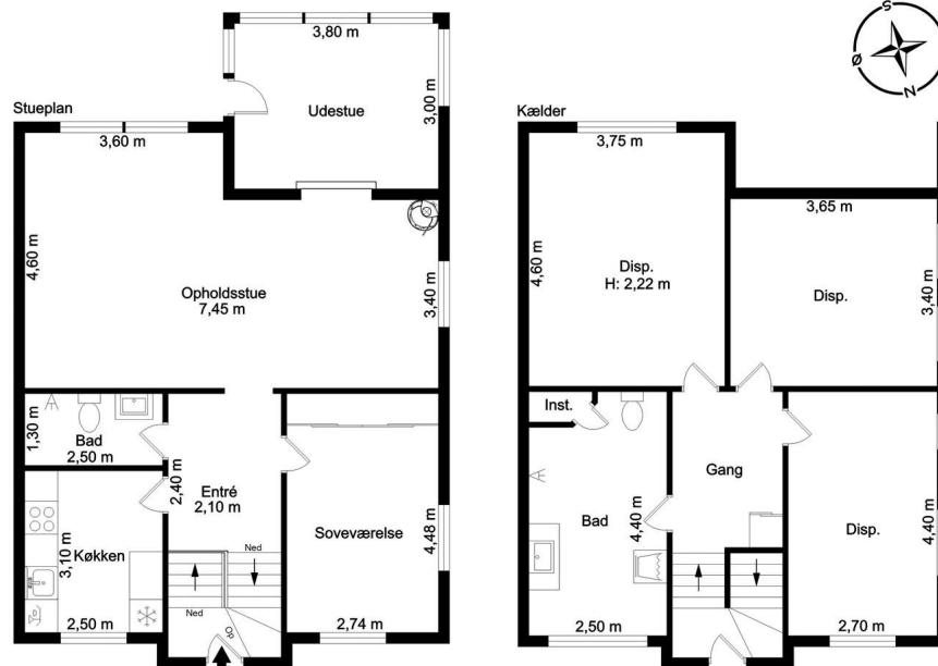
Veiledende tegning, ikke målfast