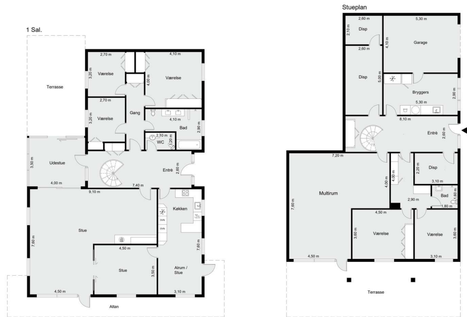
Vejledende tegning uden ansvar