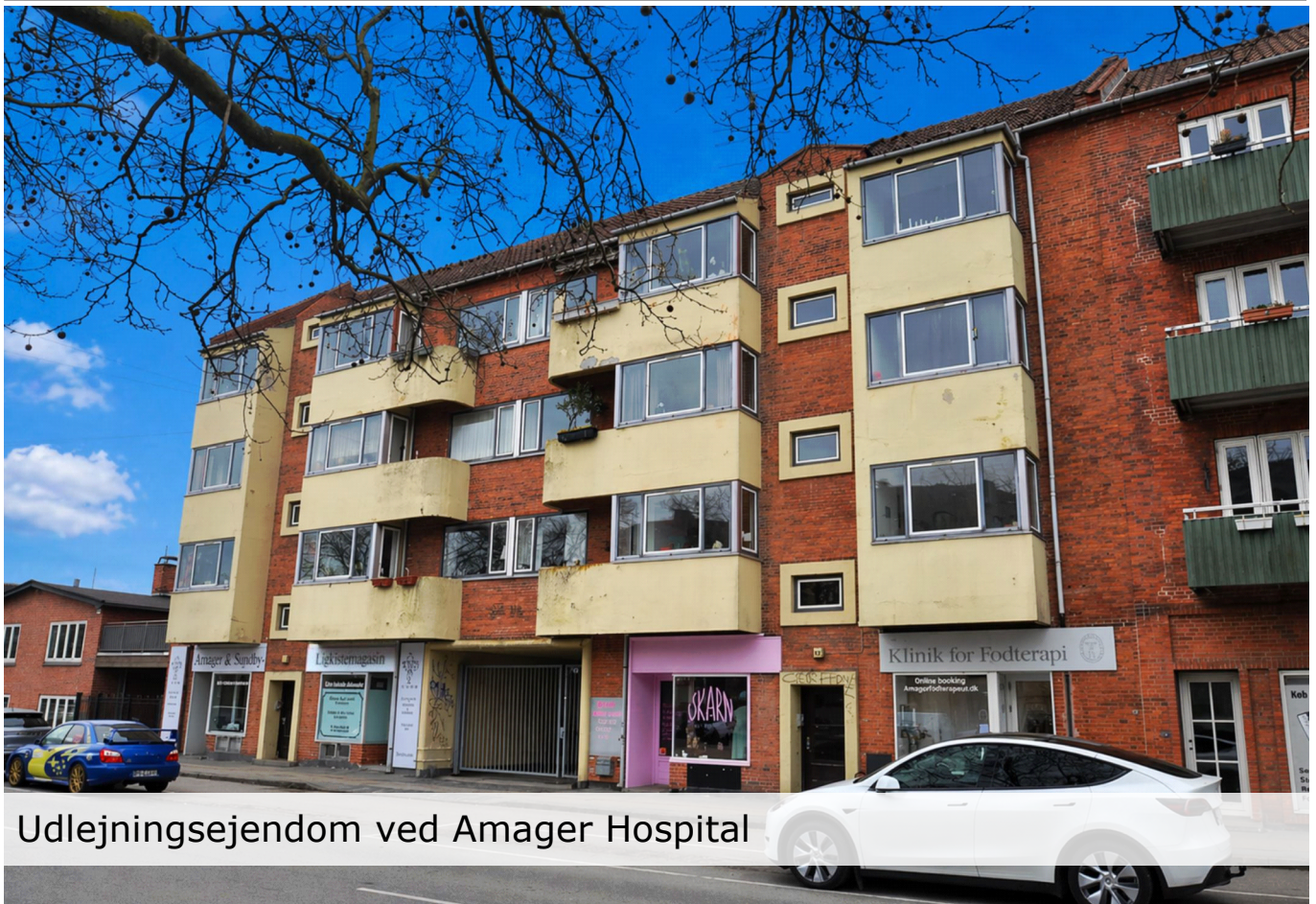
Udlejningsejendom ved Amager Hospital