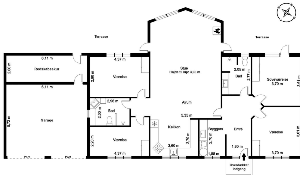
Vejledende tegning, ikke målfast