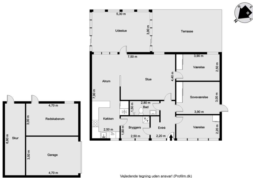
Vejledende tegning uden ansvar! (Profil.m.dk)