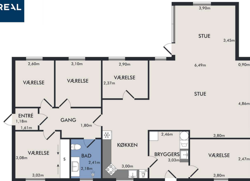
Vejledende plantegning uden ansvar