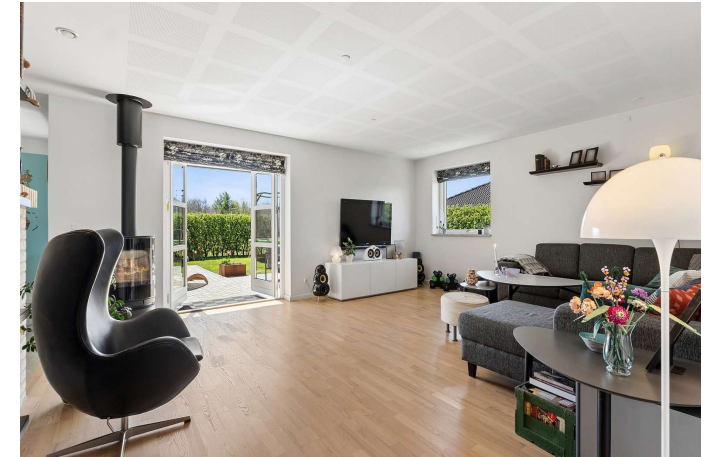
Stue med udgang til syd-/vestvendt terrasse.