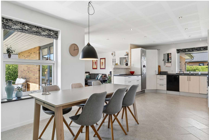
Lyst og indbydende køkken/alrum.