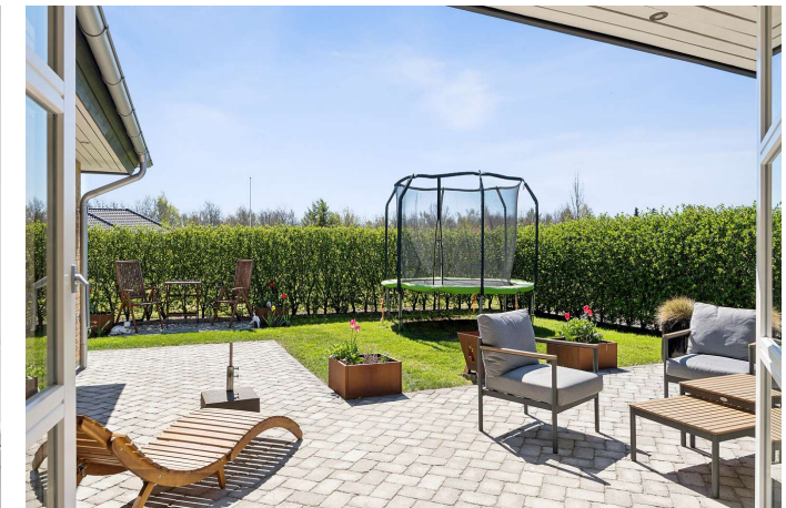
Skønt uderum med flere skønne terrasser.