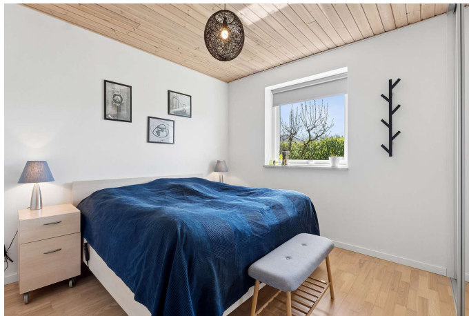
I alt 4 gode værelser.