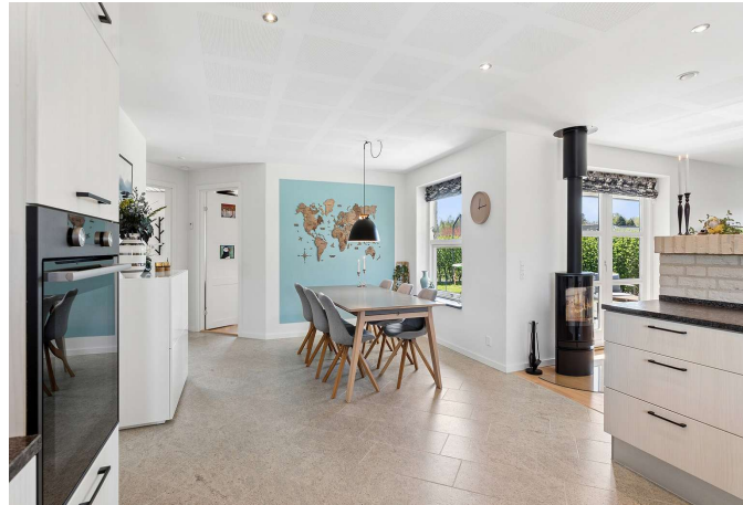
Køkken/alrum er i åben forbindelse til stuen.