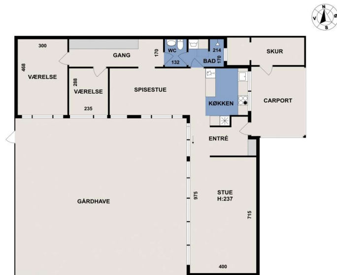
Vejledende tegning, uden ansvar. (CR3.DK)