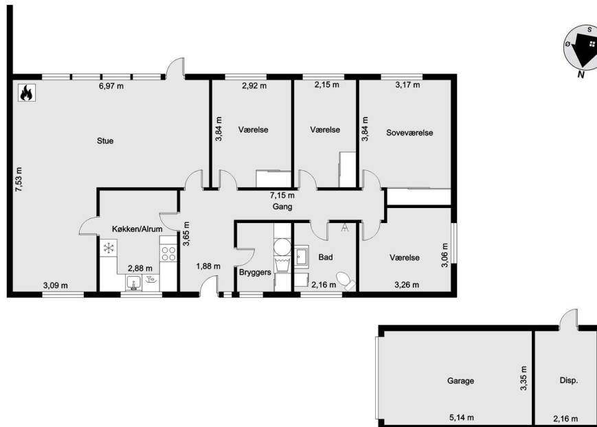
vejledende tegning uden ansvar!