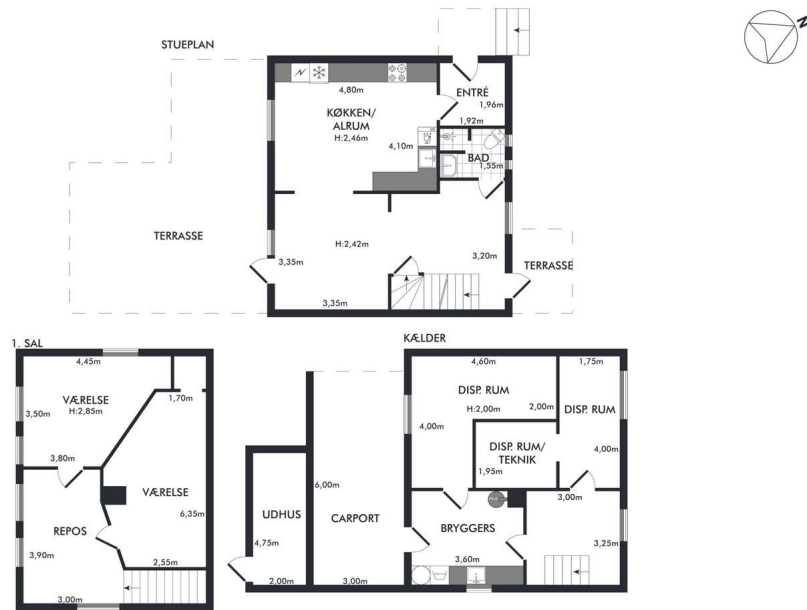
Vejledende plantegning uden ansvar