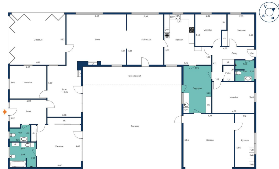
Vejledende tegning uden ansvar.