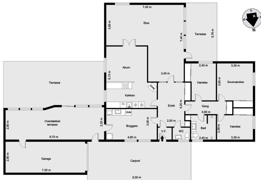
Vejledende tegning uden ansvar!