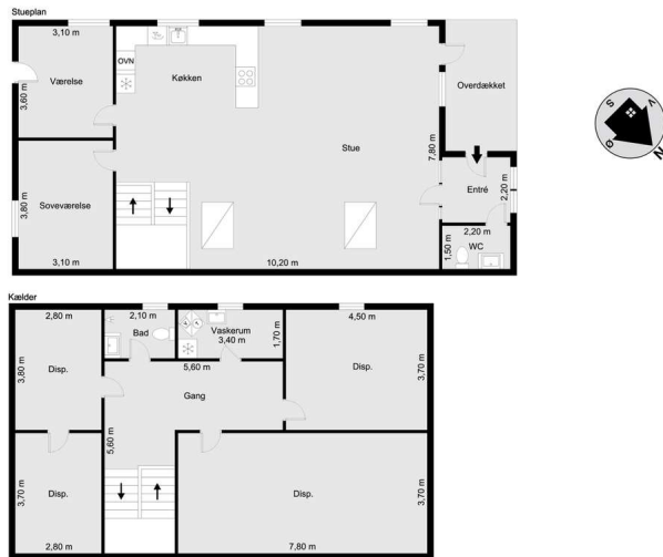
Vejledende tegning uden ansvar! (Profilm.dk)