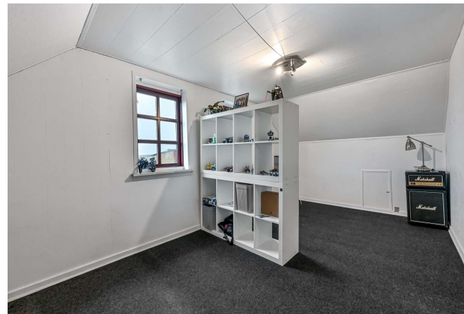
Værelse 1. sal