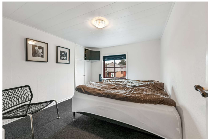
Soveværelse 1. sal