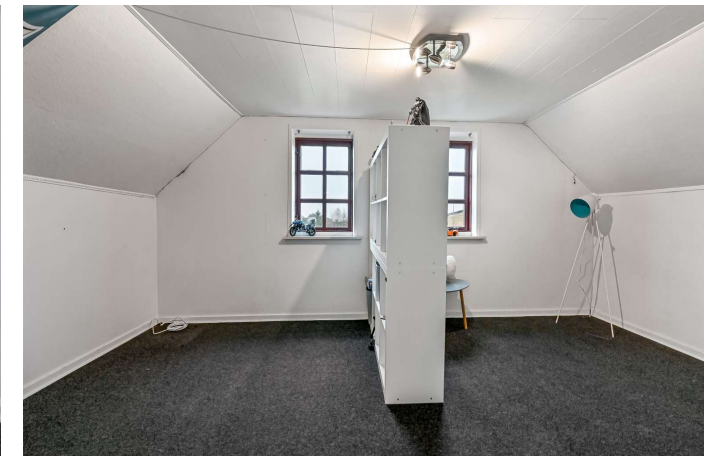
Værelse 1. sal