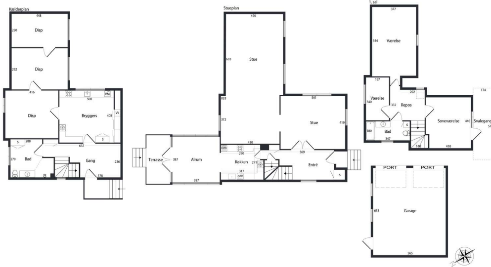
VEJLEDENDE PLANTEGNING UDEN ANSVAR BOLKIFOTOYEN