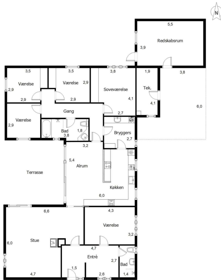
Vejledende plantegning uden ansvar.