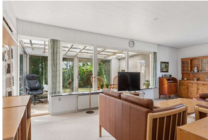
Stue med udgang til udestue.