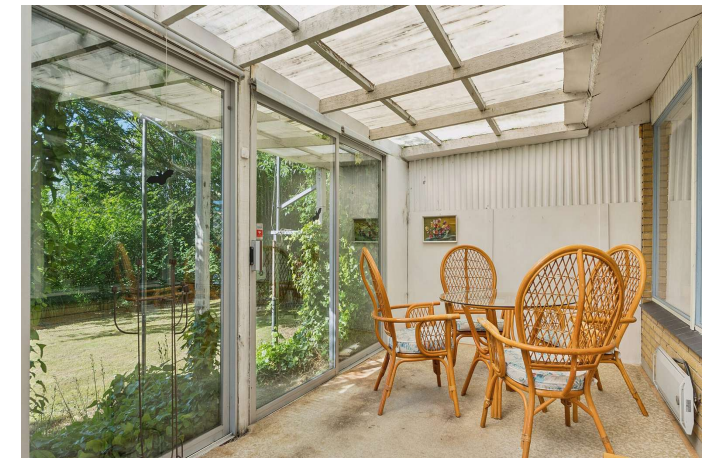
Udestue med udgang til haven.