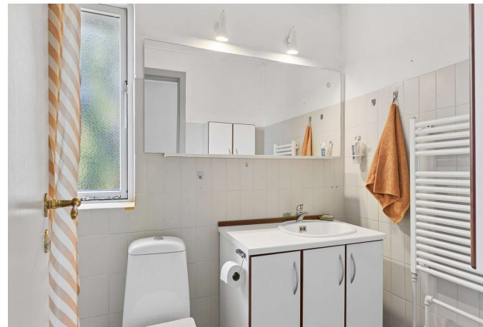
I alt 2 toiletter, herunder 1 badeværelse.