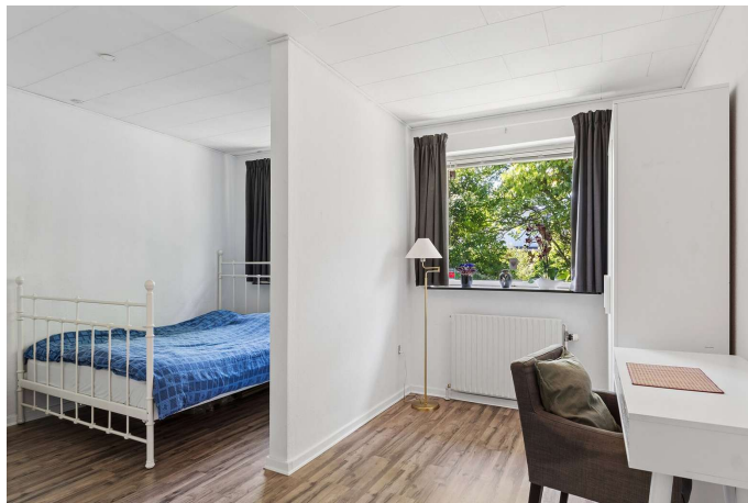
I alt 3 gode værelser.