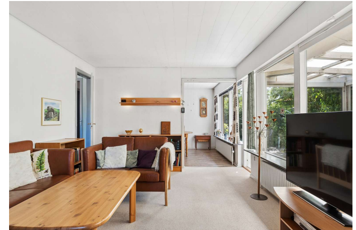
Stuen har et fantastisk lysindfald.