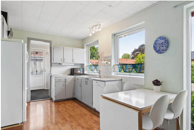
Køkken med spiseplads