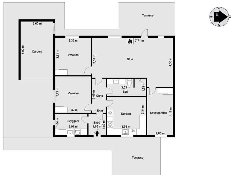
Vejledende tegning uden ansvar!