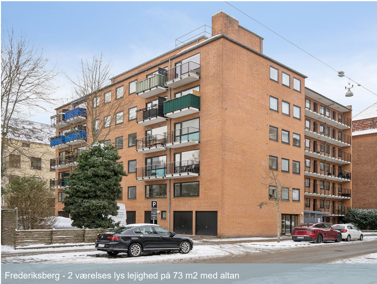
Frederiksberg - 2 værelses lys lejlighed på 73 m 2 med altan