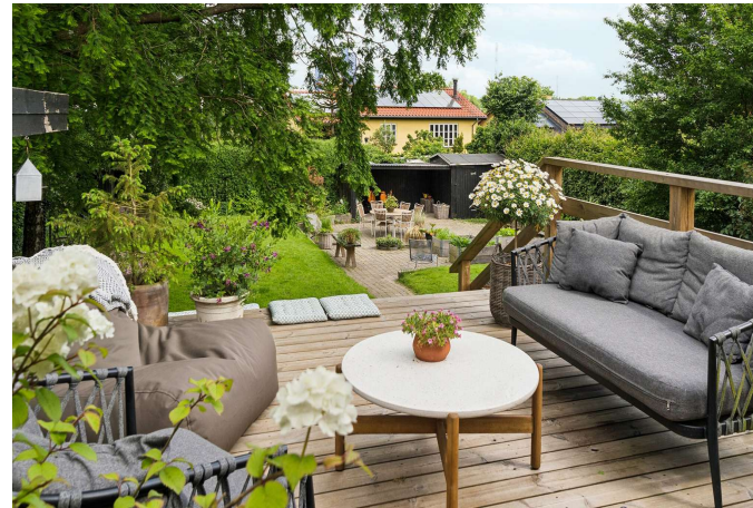
Set fra haven