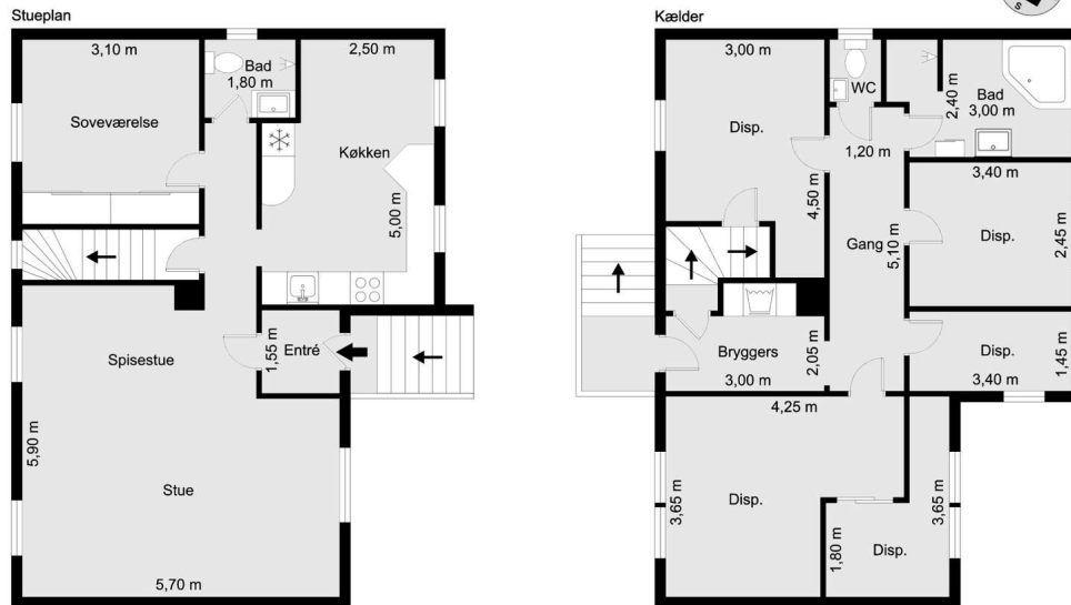
Vejledende tegning uden ansvar! (Profil.dk)