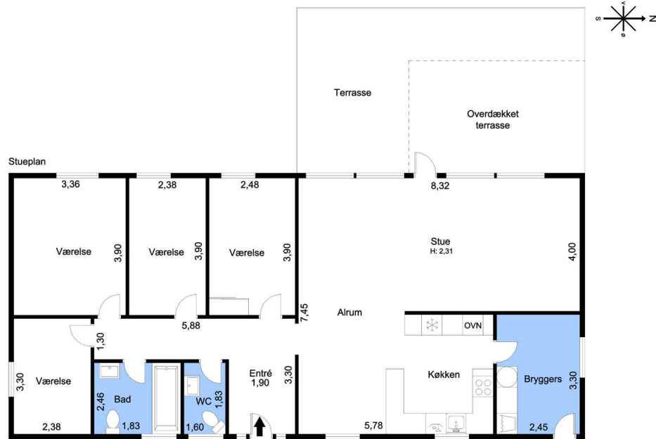
Vejledende tegning uden ansvar