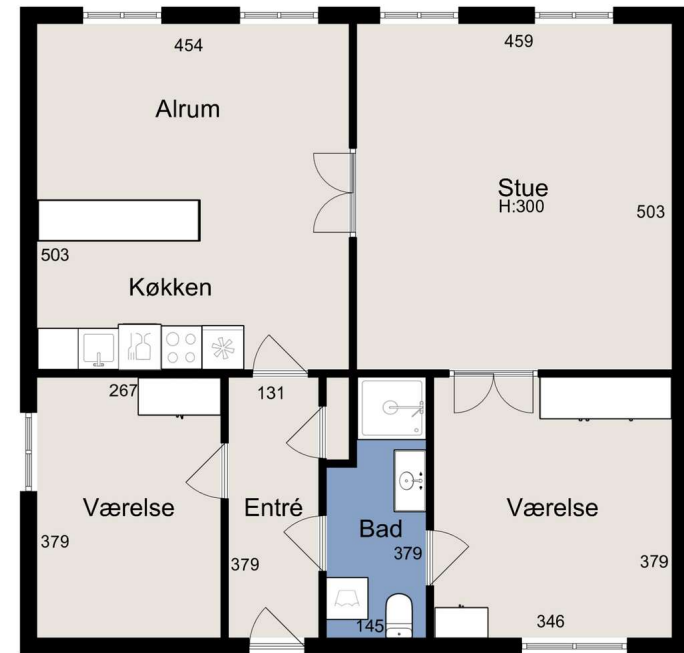
Alle plan (2x3)