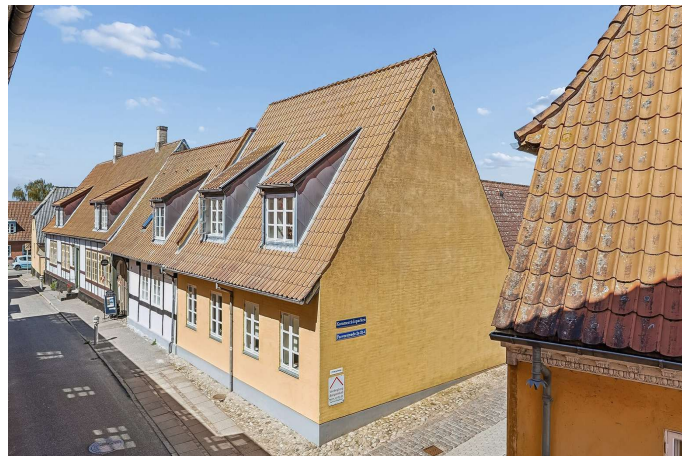
Set fra vejen