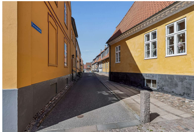
Set fra vejen