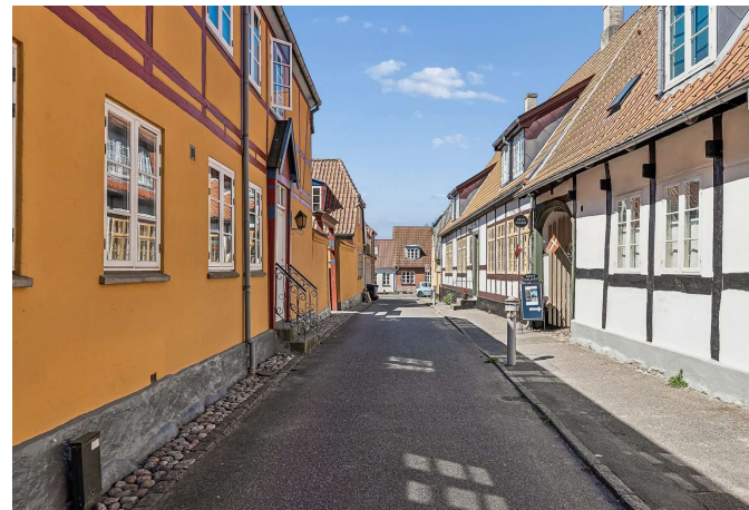
Set fra vejen