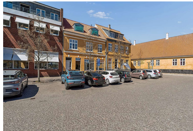
Set fra vejen