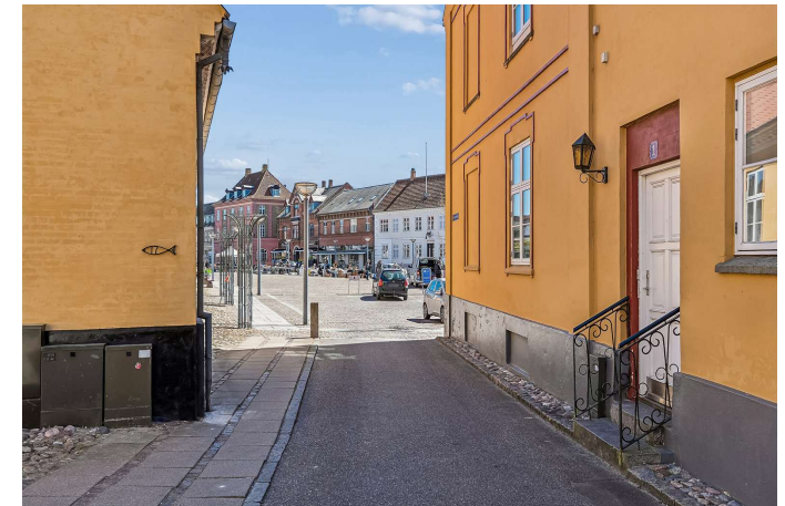
Set fra vejen