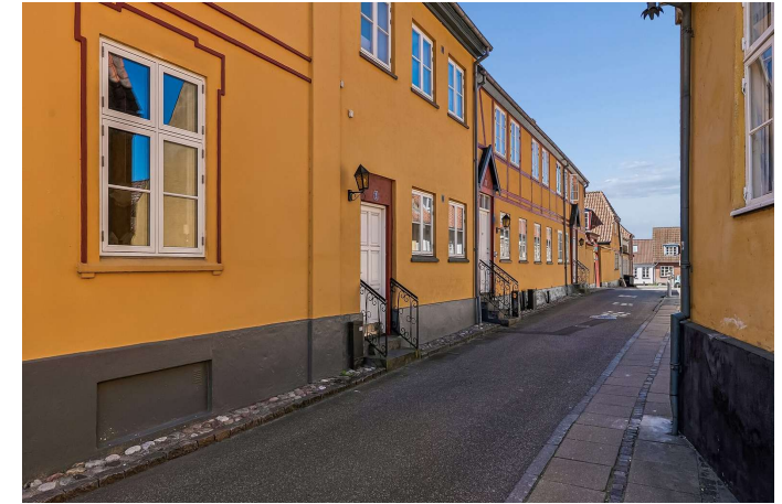
Set fra vejen