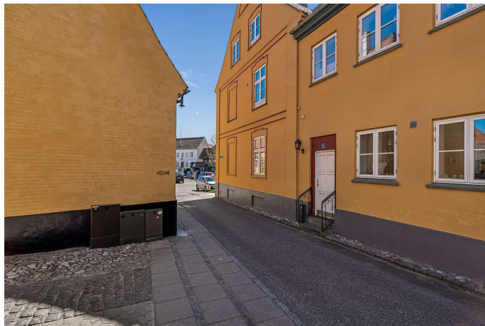
Set fra vejen