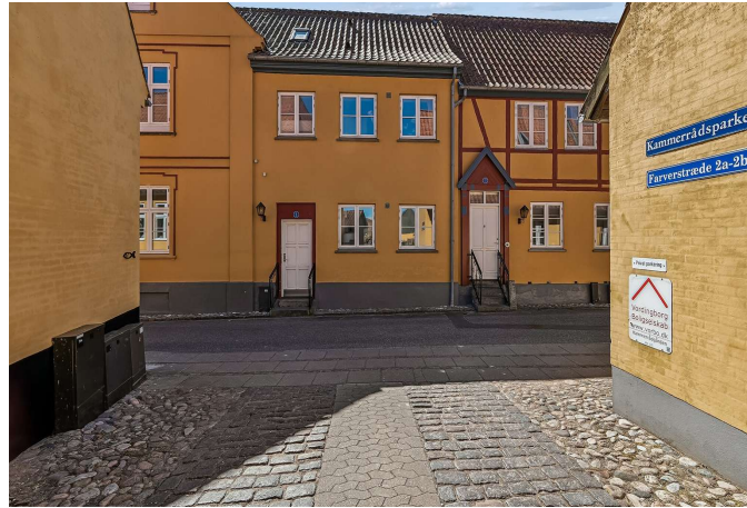
Set fra vejen