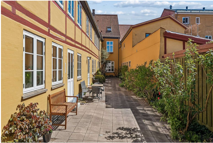
Set fra haven