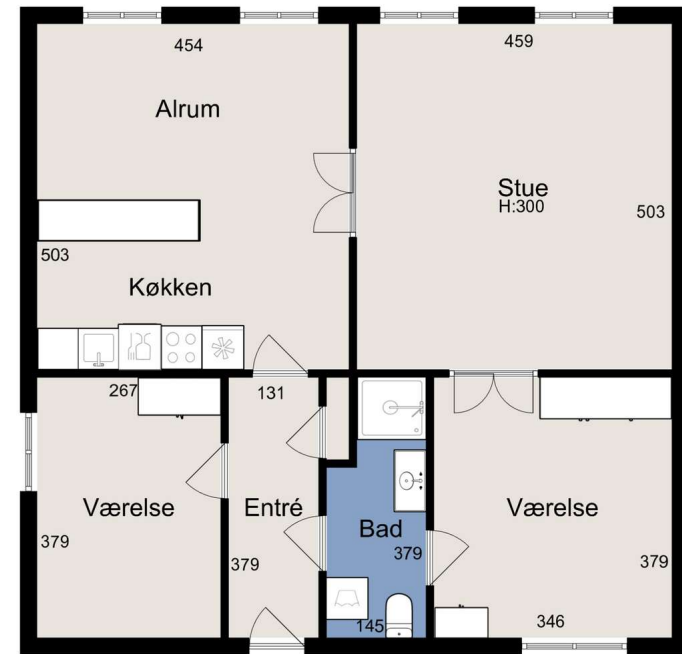
Alle plan (2x3)