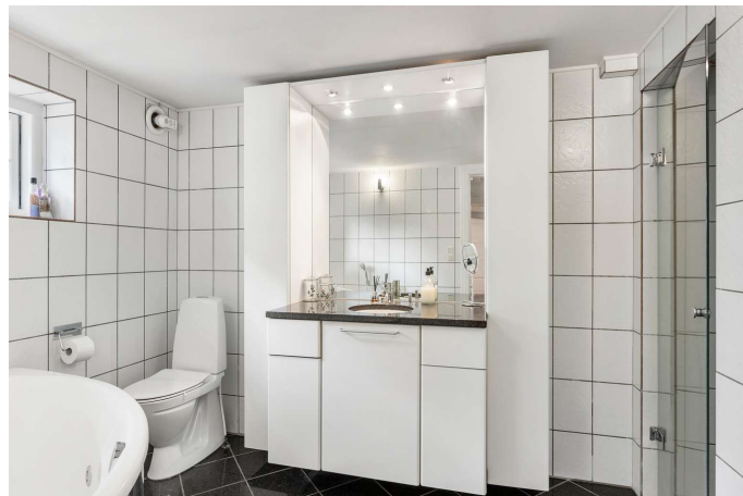
Badeværelse i kælderetage