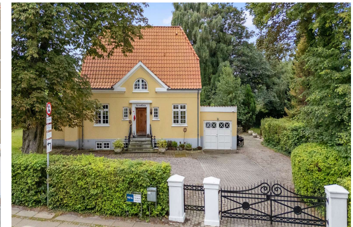
Ejendommen set fra vejen