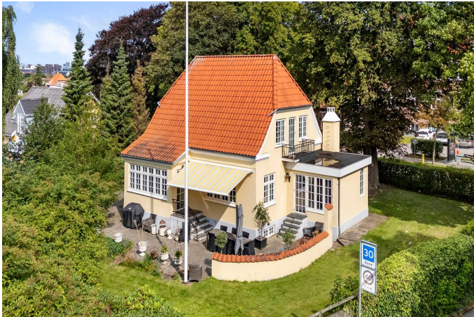
Ejendommen set fra haven