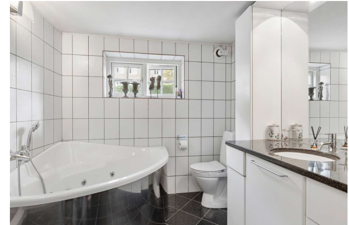
Badeværelse i kælderetage