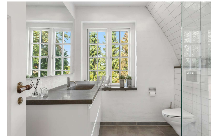
Badeværelse 1. sal