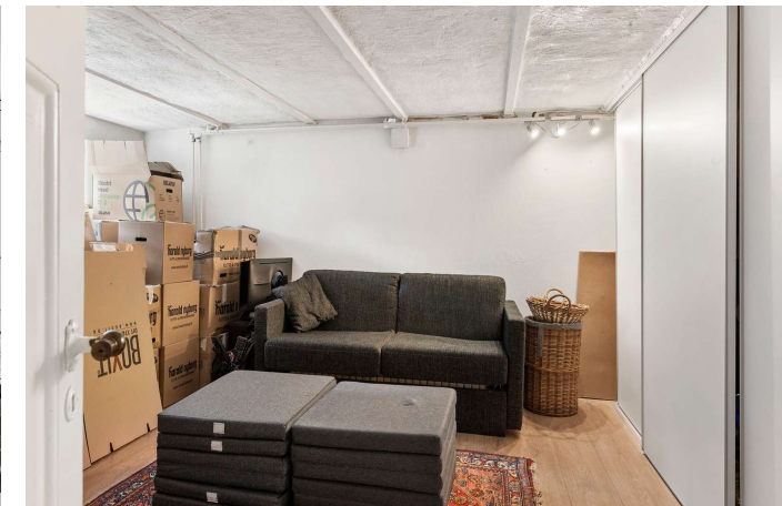
Disponibelt rum i kælderetage