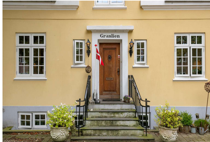
Hoveddør og trappe