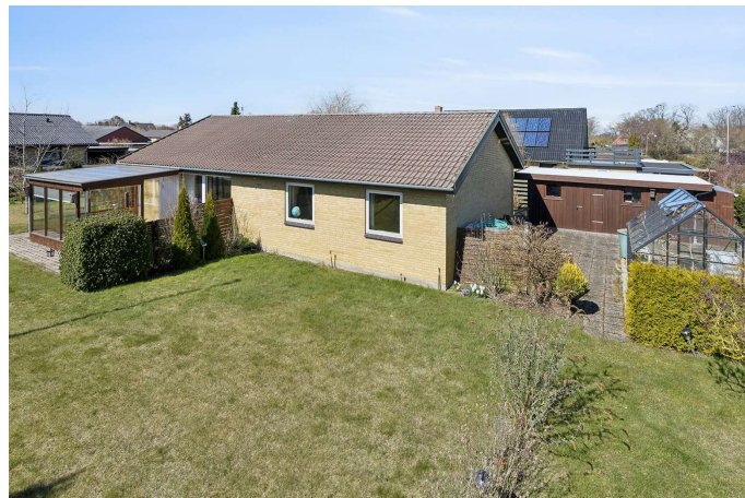
Set fra haven