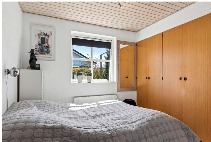
3 værelser - her soveværelse med skabsvæg.