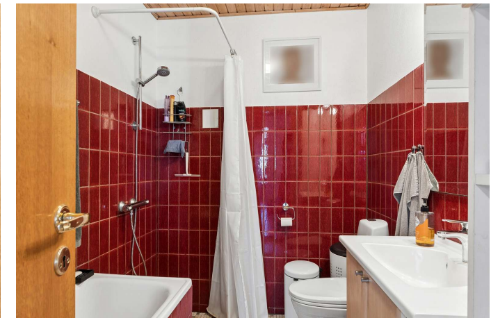
Badeværelse med brus, badekar og gulvvarme.