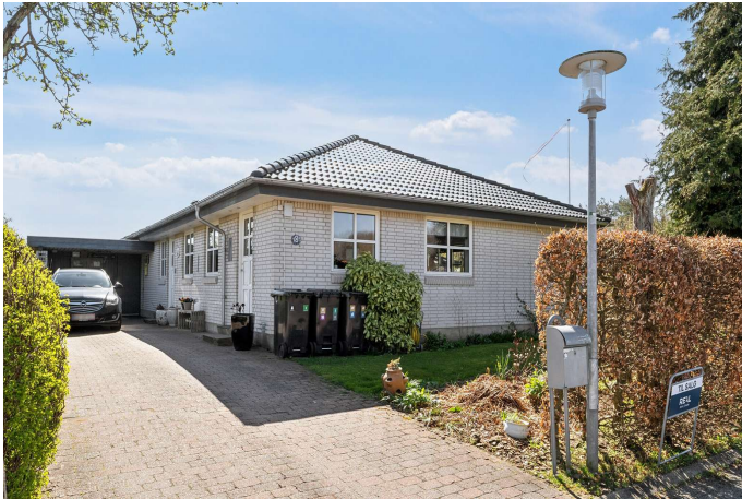
Yderst velbeliggende på lukket og børnevenlig villavej.