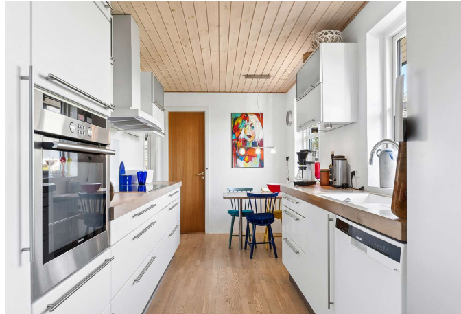
Pænt lyst køkken med spiseplads.