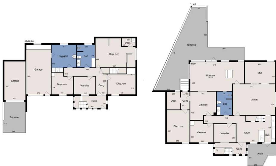
Vejledende tegning uden ansvar