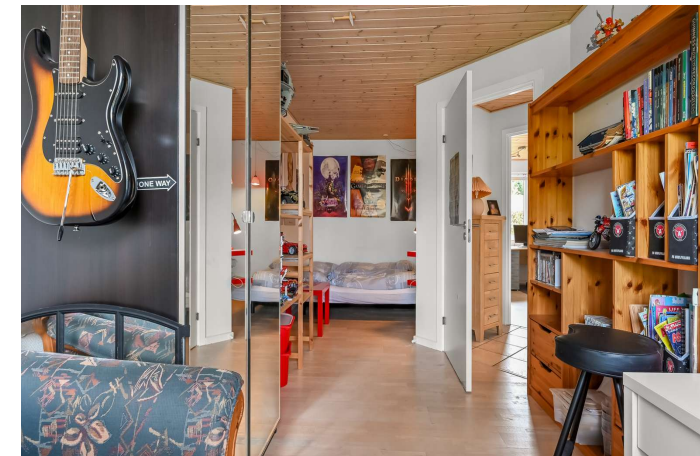
Værelse 2 af 2