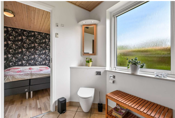
Badeværelse ved soveværelse