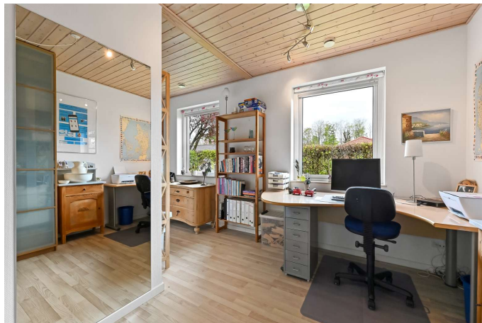
Værelse 1 af 2