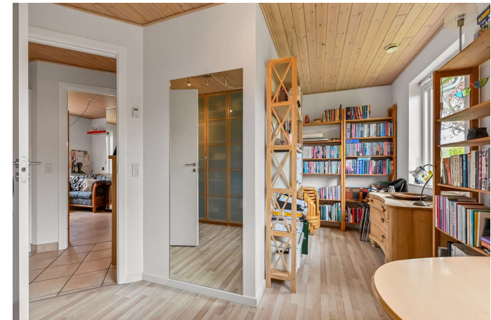
Værelse 1 af 2