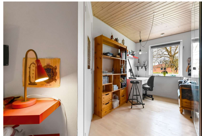
Værelse 2 af 2