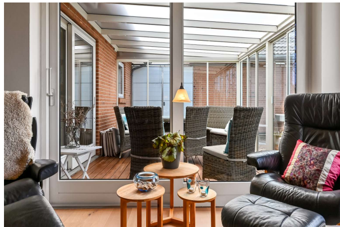
Kig til udestue