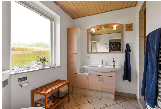
Badeværelse ved soveværelse