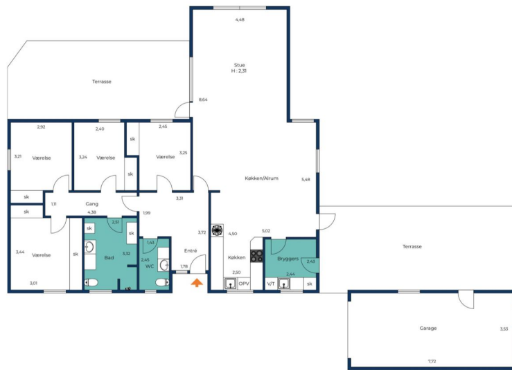
Vejledende tegning uden ansvar.