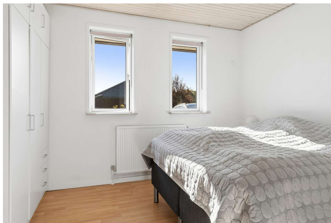
3 gode værelser.