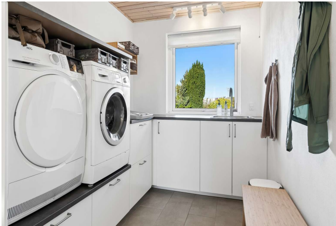
Moderniseret og pænt bryggers med klinker.