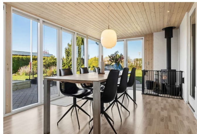
Udestue med udgang til haven/terrassen.