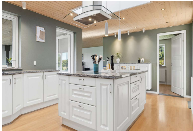
Køkken fra 2007 med ovenlys.