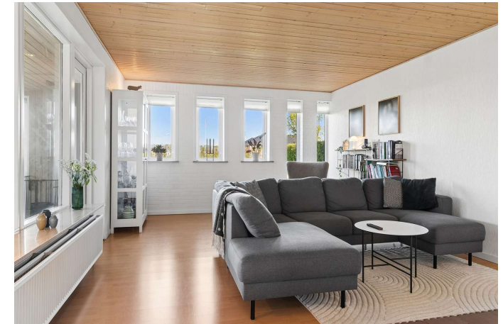
Køkken er i åben forbindelse til stuen.