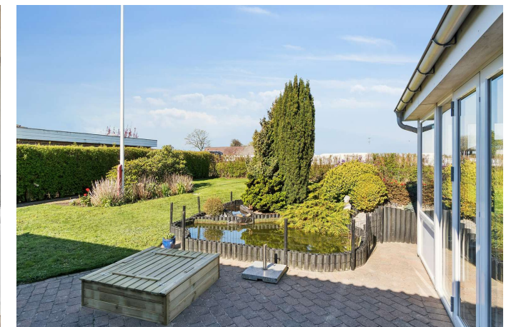
Skønneste syd-/vestvendt terrasse.