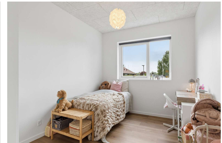
Ét af i alt 4 gode værelser.