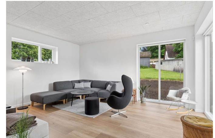
Hyggelig stue med et skønt lysindfald.