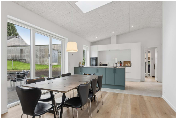
Fra alrum er der udgang til terrasse.