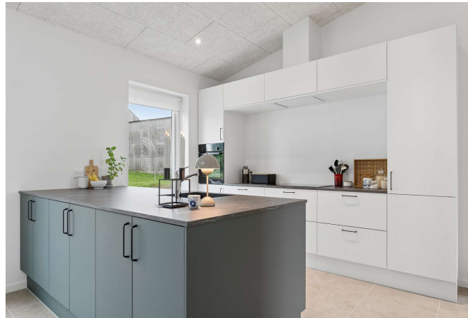
Køkken/alrum med ovenlys - skønt lysindfald!