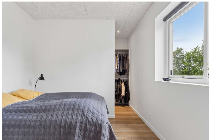
Soveværelse med adgang til walk-in & badeværelse.