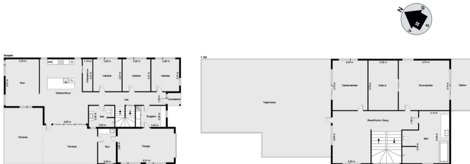
Vejledende tegning uden ansvar! (Profilim.dk)