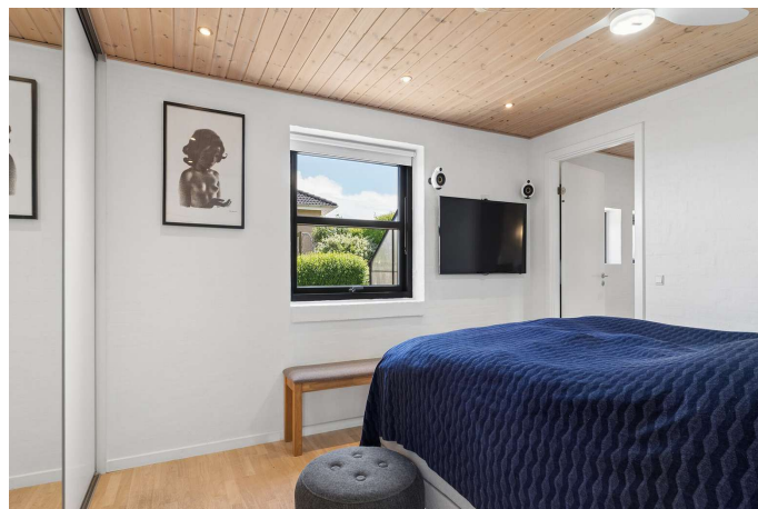
Soveværelse med adgang til badeværelse