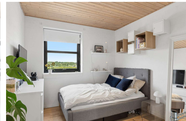
Ét af i alt 4 gode værelser.