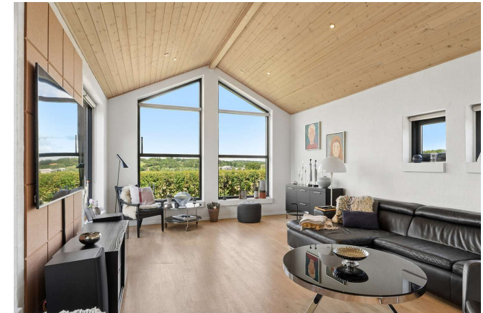
Stue med en fantastisk udsigt over sø/området.