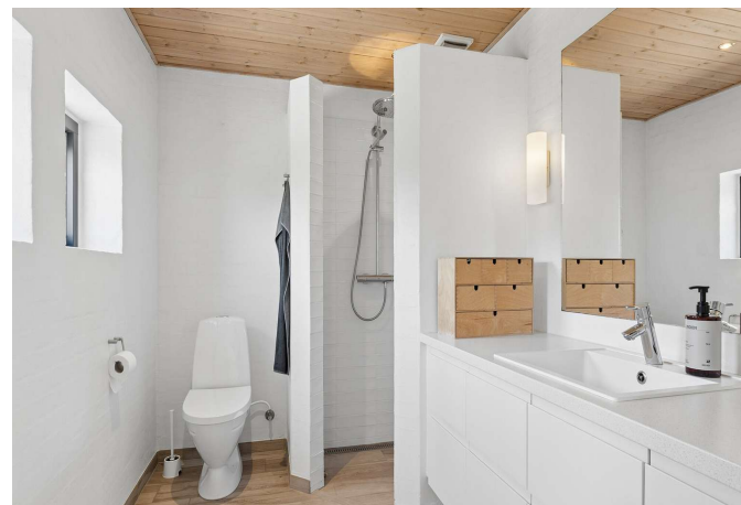
I alt 2 badeværelser med brus.