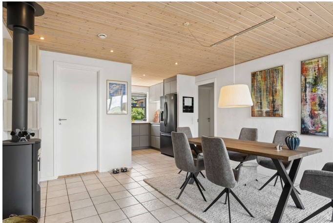
Lyst køkken/alrum i åben forbindelse til stuen.