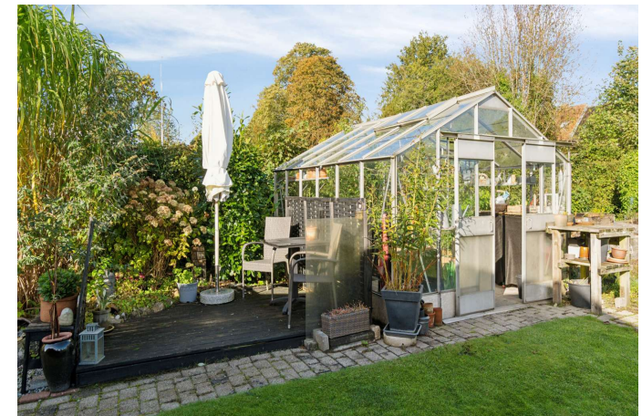
Hyggelig have med flere skønne terrasser og kroge.