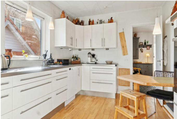
Pænt lyst køkken med spiseplads