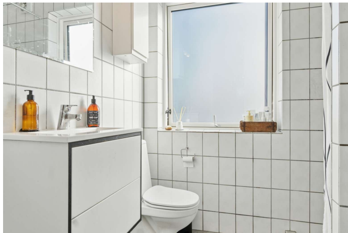
2 toiletter - ét på hvert plan.