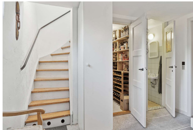
God og anvendelig underetage i delvis boligstandard.