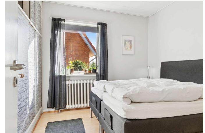
I alt 2 værelser på stueplan - let mulighed for 3 gode