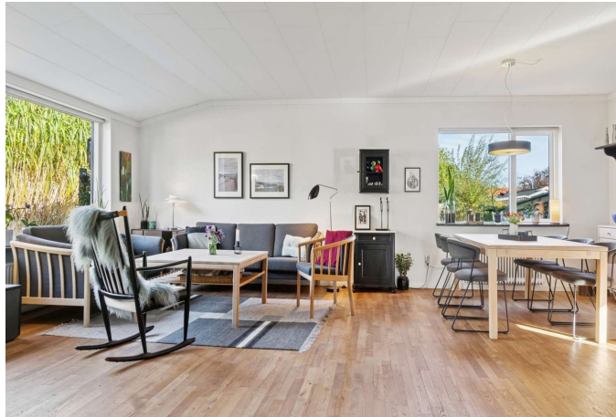
Stue med et fantastisk lysindfald og udgang til terrasse.