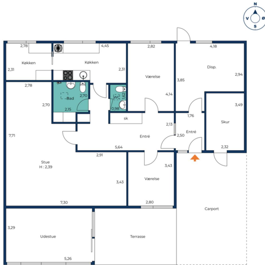
Vejledende tegning uden ansvar.